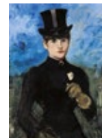
É. Manet, Die Reiterin

Nach einer Führung durch die Ausstellung verbleibt noch ausreichend Zeit für eine individuelle Betrachtung ihrer Lieblingsbilder oder für den Begleitfilm.