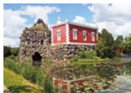
Felseninsel Stein im Schlosspark

Nach Ankunft in der Lutherstadt Wittenberg ist für den Nachmittag ein geführter Besuch im Asisi Panometer vorgesehen. Hier wird, bei einer Zeitreise in die Vergangenheit, das Leben zur Zeit Martin Luthers um 1517 gezeigt.