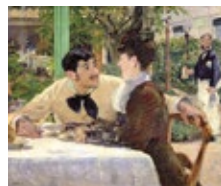
É. Manet, Chez le père Lathuille

Das Von der Heydt Museum zeigt 45 Werke von Manet, der als Wegbereiter der modernen Malerei gilt.