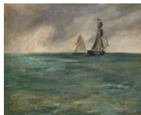
Édouard Manet, Stürmische See