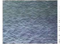
Werk: Udo Homeyer

Kunstschaffende Mitbürgerinnen und Mitbürger unserer Stadt und der Artemis Werkstatt werden das Jubiläum dazu nutzen, in den Veranstaltungsräumen eine Auswahl ihrer Arbeiten zu präsentieren.