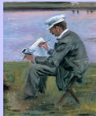
Lovis Corinth, Der Maler Leistikow